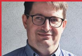
Nikolaus Hahn Archiv